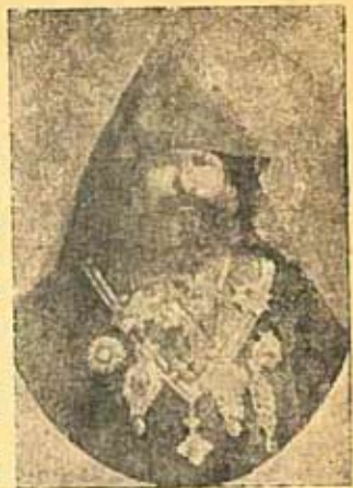
Խորէն Արքեպիսկ. Նար.Պէյ

(8) ԽՈՐԷՆ ԿՐԵՊԻՍԿՈՊՈՍ ՆԱՐ.ՊԷՅ. — Հայ բանաստեղծ եւ ասննախօս որ ծնած է 1831ին եւ մեռած 1892ին, Սիրուն քերթուածներու երեք հատորներ ունի, Վարդենիի, Բնար Պանդխան, Սուրբ Հայկակաճի, նաեւ Ալաֆրանկո անուն կատակերգութիւն մը: Մեծ յաջողութեամբ զբարար ոտանաւորի թարգմանած է Լամարթիի քերթուածներէն հատոր մը, Ասոնցմէ գտտ մէկ քանի դասագիրքեր ալ յօրինած է: