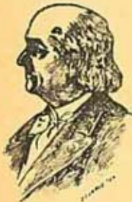
Լըրոնթ տը Լիլ

(2) Լըֆոնք ար Լիլ — Ֆրանսացի բանաստեղծ (1818—1894), որ ունի ինքնատիպ քերթուածներ, Հաւատարիմ կերպով թարգմանած է յունարենէ ֆրանսերէնի Հովերոսի, Սոփոկլէսի եւ Թէոկրիտի գործերը։