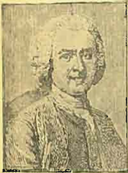
Ժան Ժար Ռուսօ

Մինչև տուն կը դառնամ: ներս մտնելու պահուս, կը լսեմ Պ. Լամպէրսիէի բարձրաձայն քրքիջներուն ձայնը. կը կարծեմ թէ իմ վրաս կը խնդայ, և, անոնց ենթարկուելուս ամօթանար, չեմ համարձակիր դուռը բանալ: Այդ միջոցին կը լսեմ որ Օր. Լամպէրսիէ սիրտ կը հատցնէ ինծի համար և սպասուհիին կ'ըսէ որ լապտերը առնէ, և Պ. Լամպէրսիէ կը պատրաստուի երթալ զիս փնտռել իմ աներկիւղ զարմիկիս հետ: Էկտեղ, որուն պիտի վերագրուի հուսկ ուրեմն արշաւանս, չիմ բոլոր պատիւը անտարակոյս: